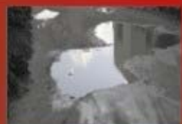
Contro gli allagamenti una nuova rete fognante bianca