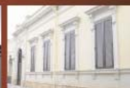
Centro per la famiglia (Via Crocefisso)