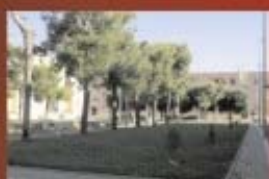
Sistemazione piazzette Via Montegrappa