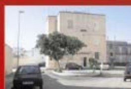
Sistemazione piazzette Villa Cleopazzo