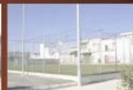
Campo di calcetto in erba sintetica (Piazza Senatore Pulli)