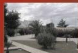
2 campi da tennis (Piazza S. Pulli)