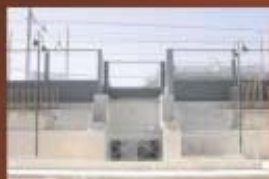
Sottopasso pedonale e ciclabile (via B. Croce - Via xxv Luglio)