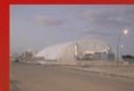
Centro Polivalente per lo sport e lo spettacolo