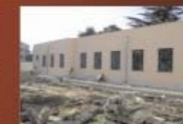
Poliambulatorio Via Risorgimento