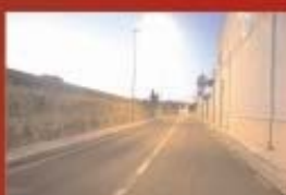
3 Km di marciapiedi comunali