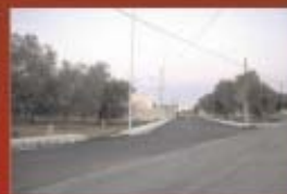
Urbanizzato l'intero Quartiere Madonna dell'Alto