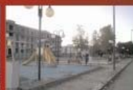
Parco giochi nel quartiere Madonna di Fatima