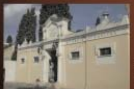
Sistemazione Cimitero Comunale nuove strade, più verde.