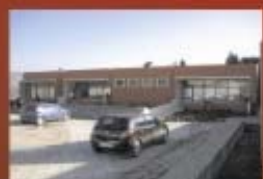
Scuola di formazione Via Carso