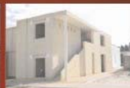
Cappelletta nel nuovo Cimitero Comunale