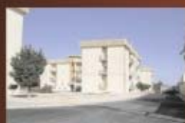
Sistemazione piazzette zona Marco Polo